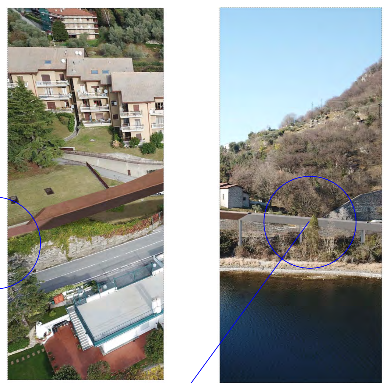
SEZIONE 09 progressiva 63,15